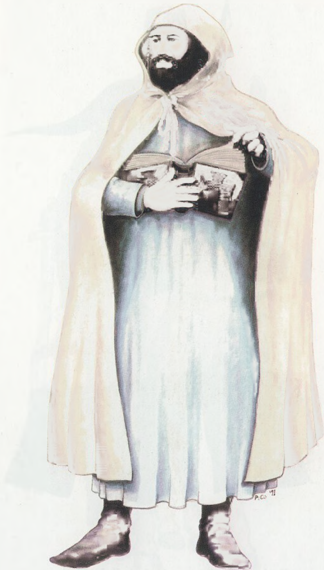
Redovnik vitez templar u "kućnoj" odjeći (XII. i XIII. stoljeće)