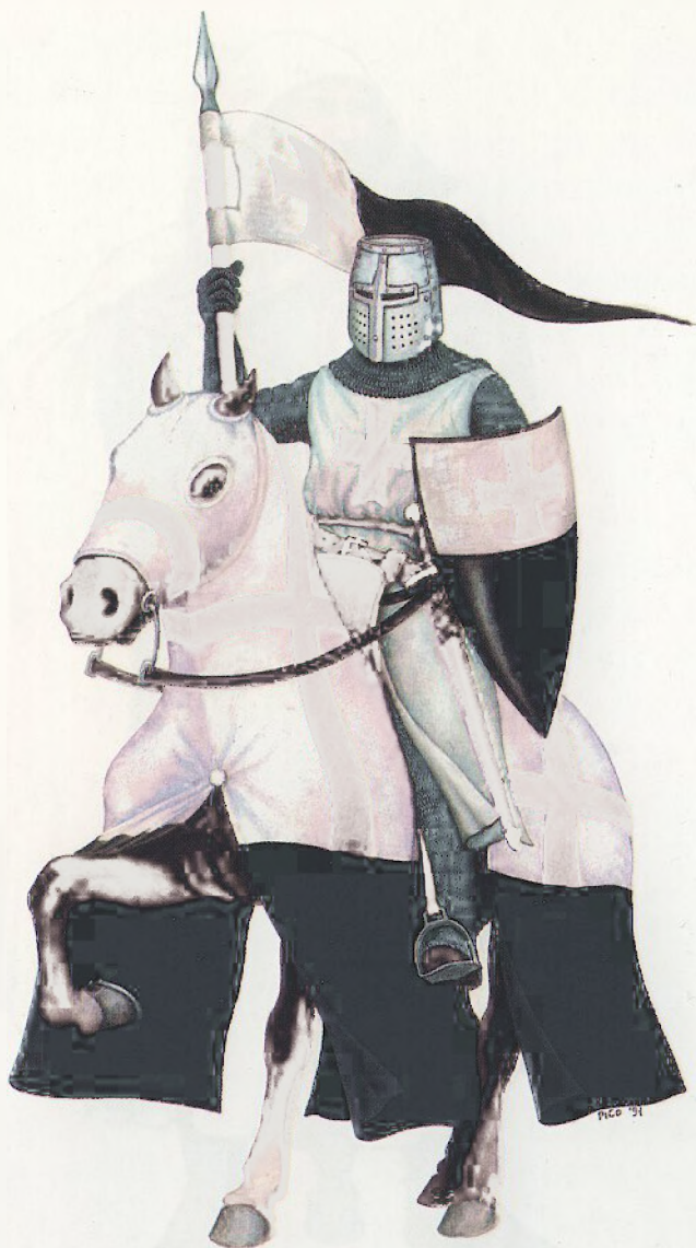
Redovnik vitez zapovjednik konjičke bojne hramskih vitezova ( conrois ) (polovica XIII. stoljeća)