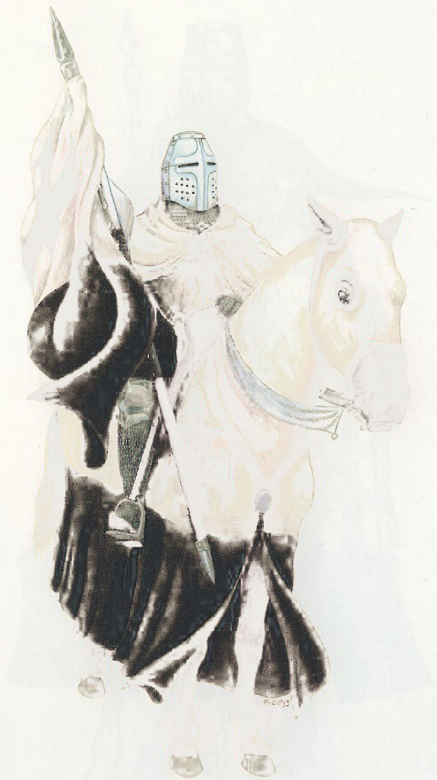
Upravitelj provincije templarskog reda s dvobojnim barjakom ( baucent ) (polovica XIII. stoljeća)