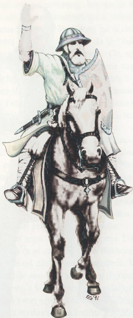
Templar zapovjednik turkopola, tj. vojnika, često srednjoistočnog podrijetla, u službi Hrama (druga polovica XII. stoljeća)