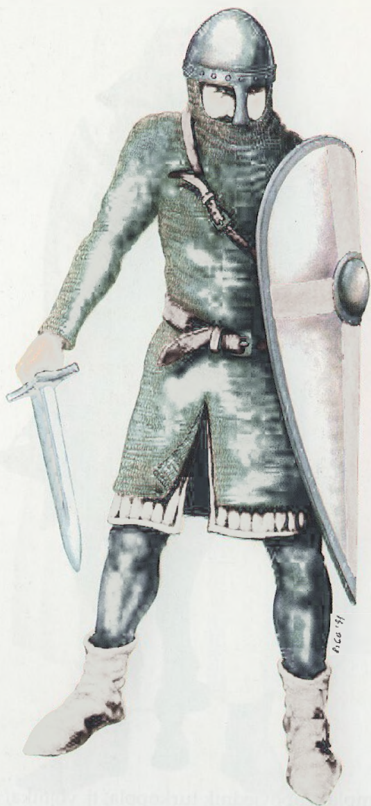
Redovnik vitez pripadnik "Kristovih vojnika" (početak XII. stoljeća)