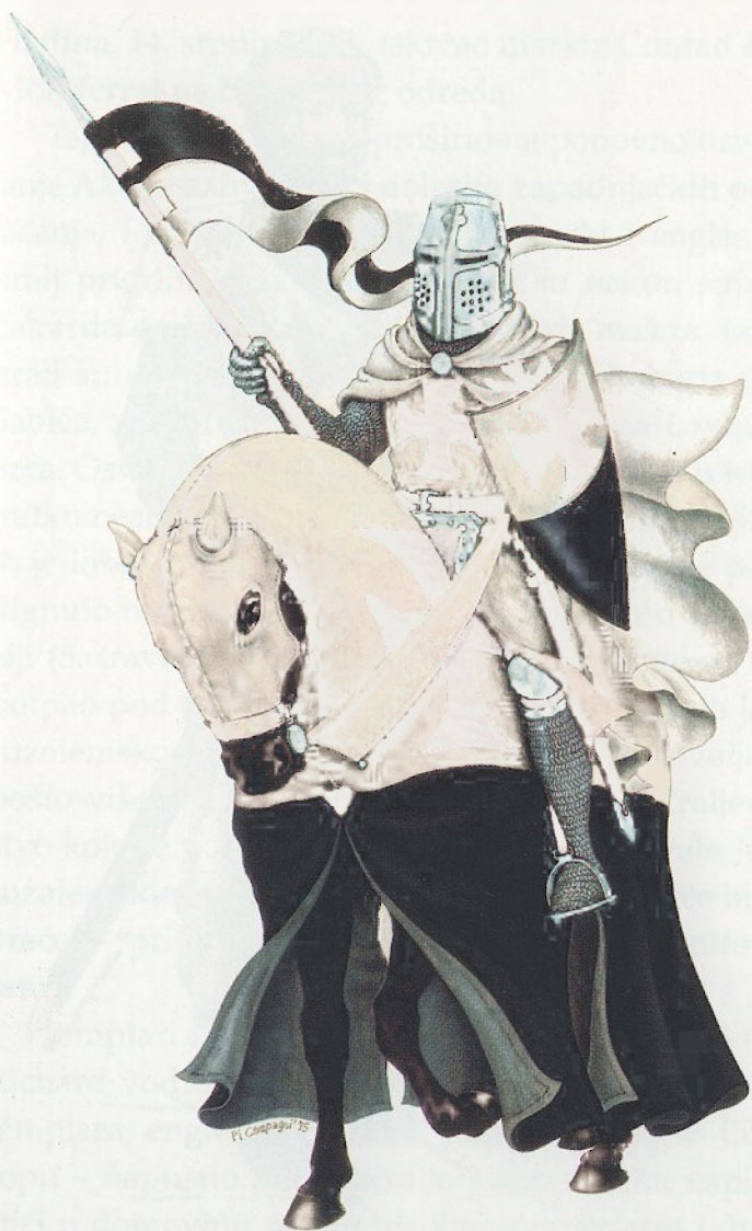
Redovnik vitez zapovjednik konjičke bojne hramskih vitezova ( conrois ) (druga polovica XIII. stoljeća)